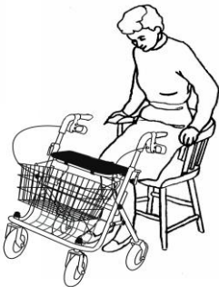
4 لرسم التوضيحي رقم