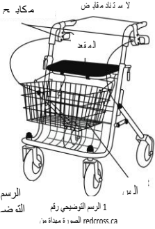
الرسم التوضيحي رقم 1

عادةً ما تكون المشاية ذات الـ 4 عجلات مزودة بمقعد وحقيبة أو سلة ومكابح تشغلها باستخدام اليد (انظر الرسم التوضيحي رقم 1). ويتم طيها أيضًا في حالة التخزين أو السفر.